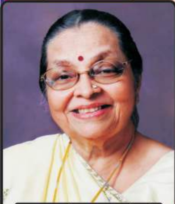
અક્ષુદાન અને ત્વચાદાન કરેલ છે.